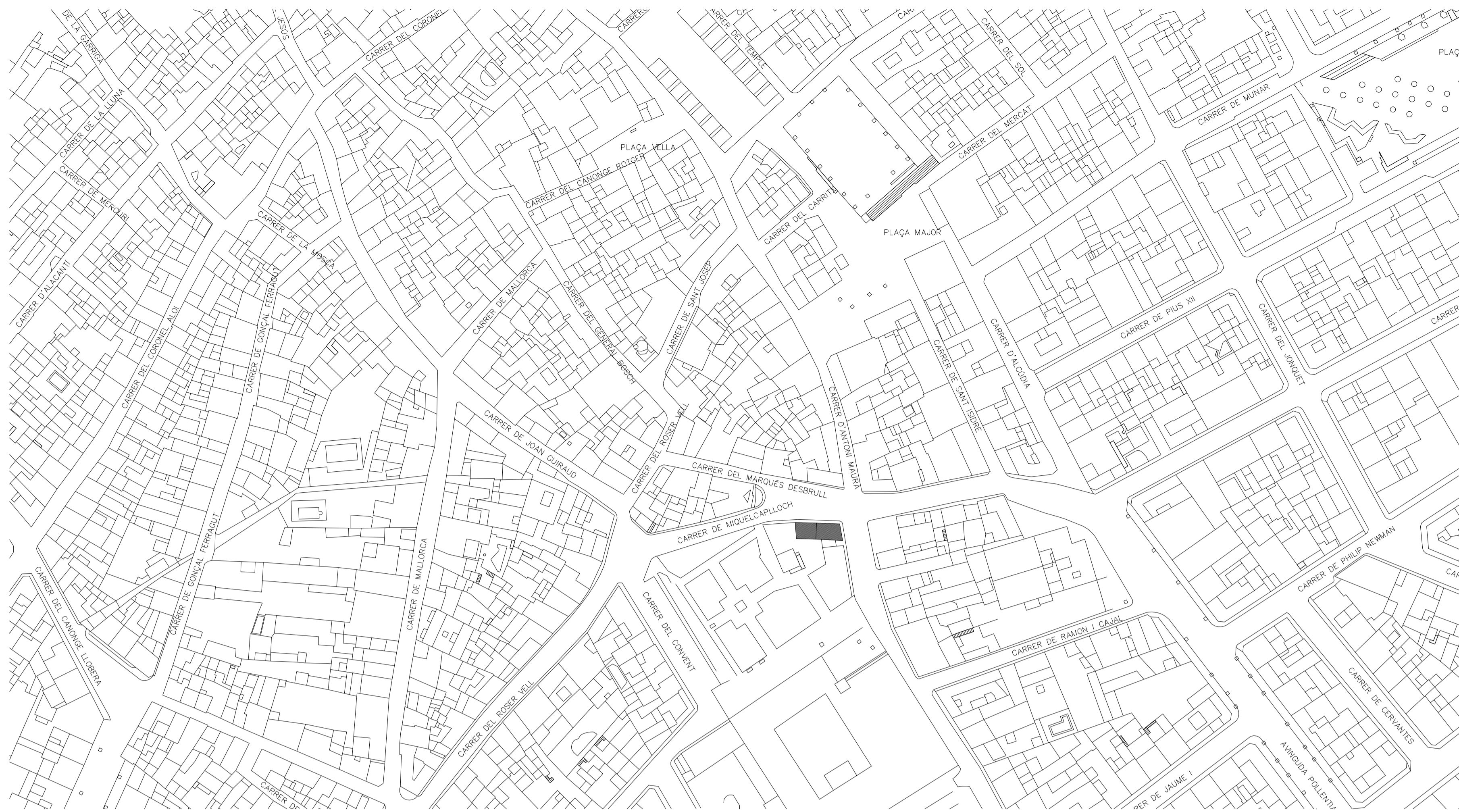
⊕ PLANOL SITUACIÓ E.1/1000 (T.M. POLLENÇA)